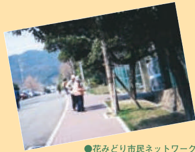
●花みどり市民ネットワーク 神戸市で広がる緑のまちづくり

特集では、新しい公園文化の方向性はもちろん、具体的なビジョンまでを、さまざまな角度から追求していきます。