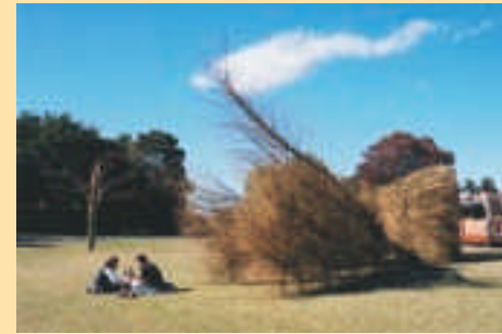
●草月会東京西支部 「よみがえる樹々のいのち展」を公園で開催