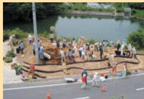
●市民の手によるまちづくり 地域の緑化活動をするボランティア 「まちづくりガーデナー」が続々誕生している