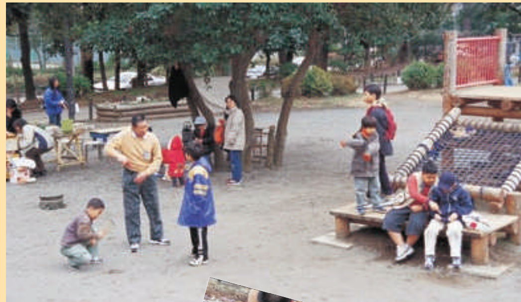
●戸山公園遊びを考える会 子どもたちを自由に思いっきり遊ばせたい