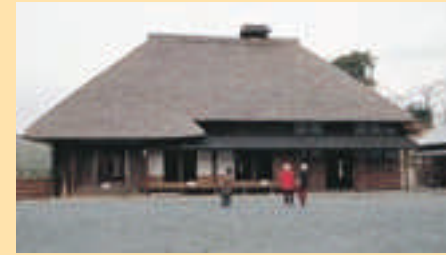
●本郷ふじやま公園運営委員会 古民家の公園移築をパートナーシップ推進モデル事業に