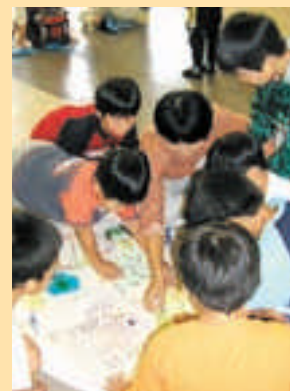
●まちワーク研究会 手作りのプログラムやグッズで子どもの遊びを応援