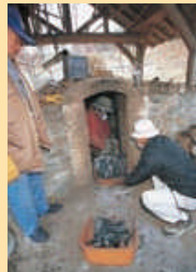
●一本杉炭やき倶楽部 炭焼きを通してまちの環境を考える