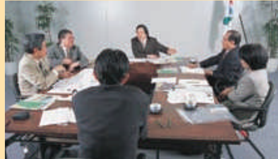
●座談会 公園に関わる各界のエキスパートが語る公園文化の未来像