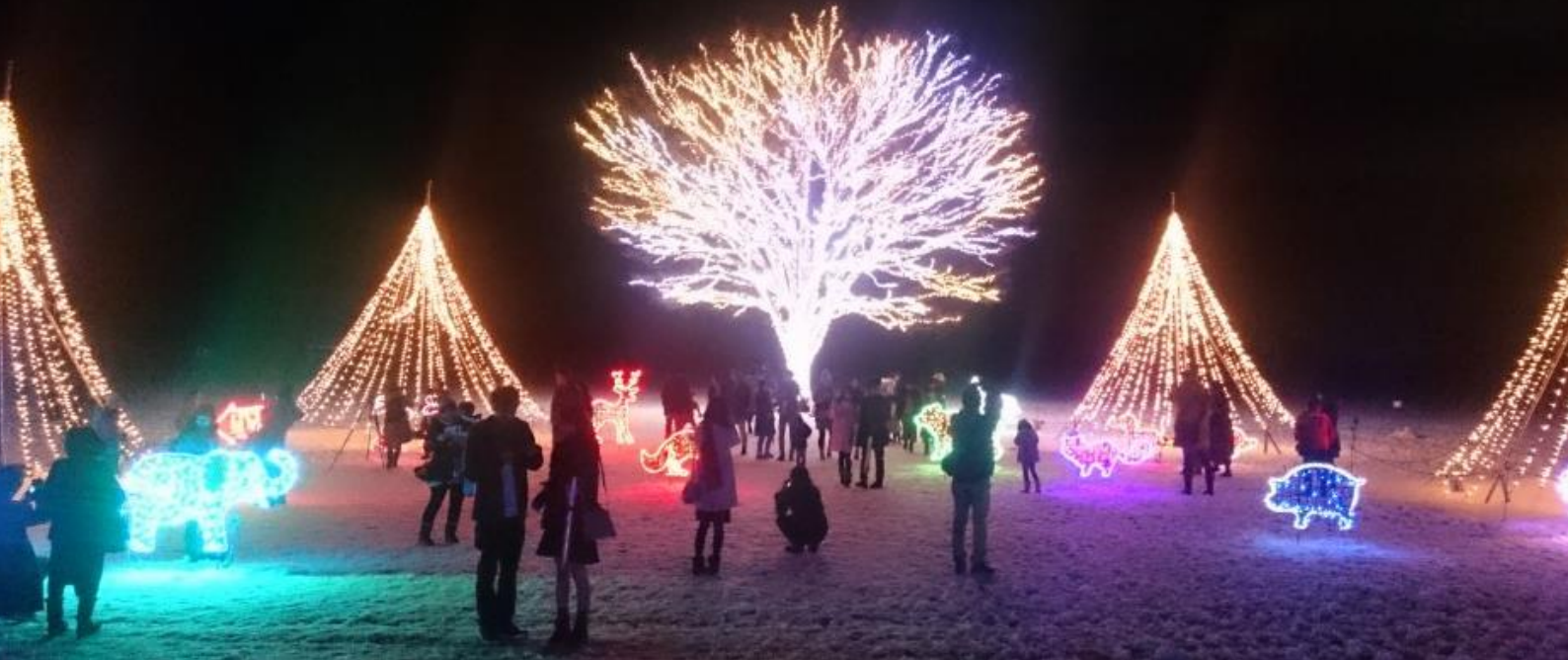
雪原に輝く「きらめきの大ケヤキ」(本年12月17日撮影)