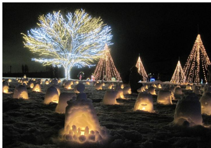
「キャンドルを灯そう」(H26年度撮影写真)

※12月23日(金祝)~25日(日)に予定しておりました「キャンドルを灯そう」は、積雪が無いため中止とさせていただきます。