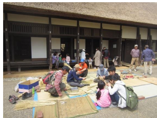
古民家前でわらホウキづくりも開催!(4/9)