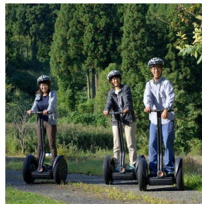
セグウェイ無料体験(4/9)