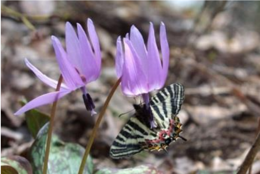
カタクリを吸蜜するギフチチョウ