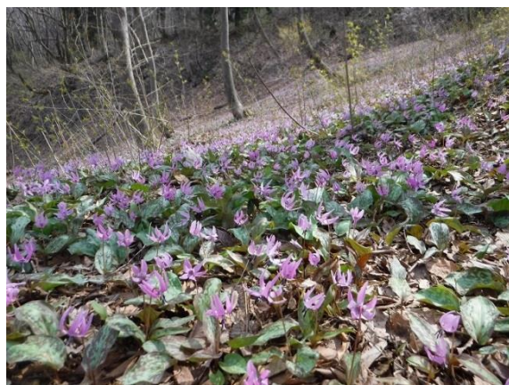
見頃を迎えた昨年のカタクリ大群落

本公園では、カタクリの保全・育成を目指し、平成16年から下草刈りなどの整備を行ってきました。その結果、カタクリ大群落のカタクリは年々数が増加し、現在推定100万株以上の自生に至っています。カタクリ大群落は雪解けの早い斜面上部から順番に花が開花します。見渡す限り薄紫の絨毯 じゅうたん は圧巻です!この時期しか見ることのできない感動の風景をお楽しみください。