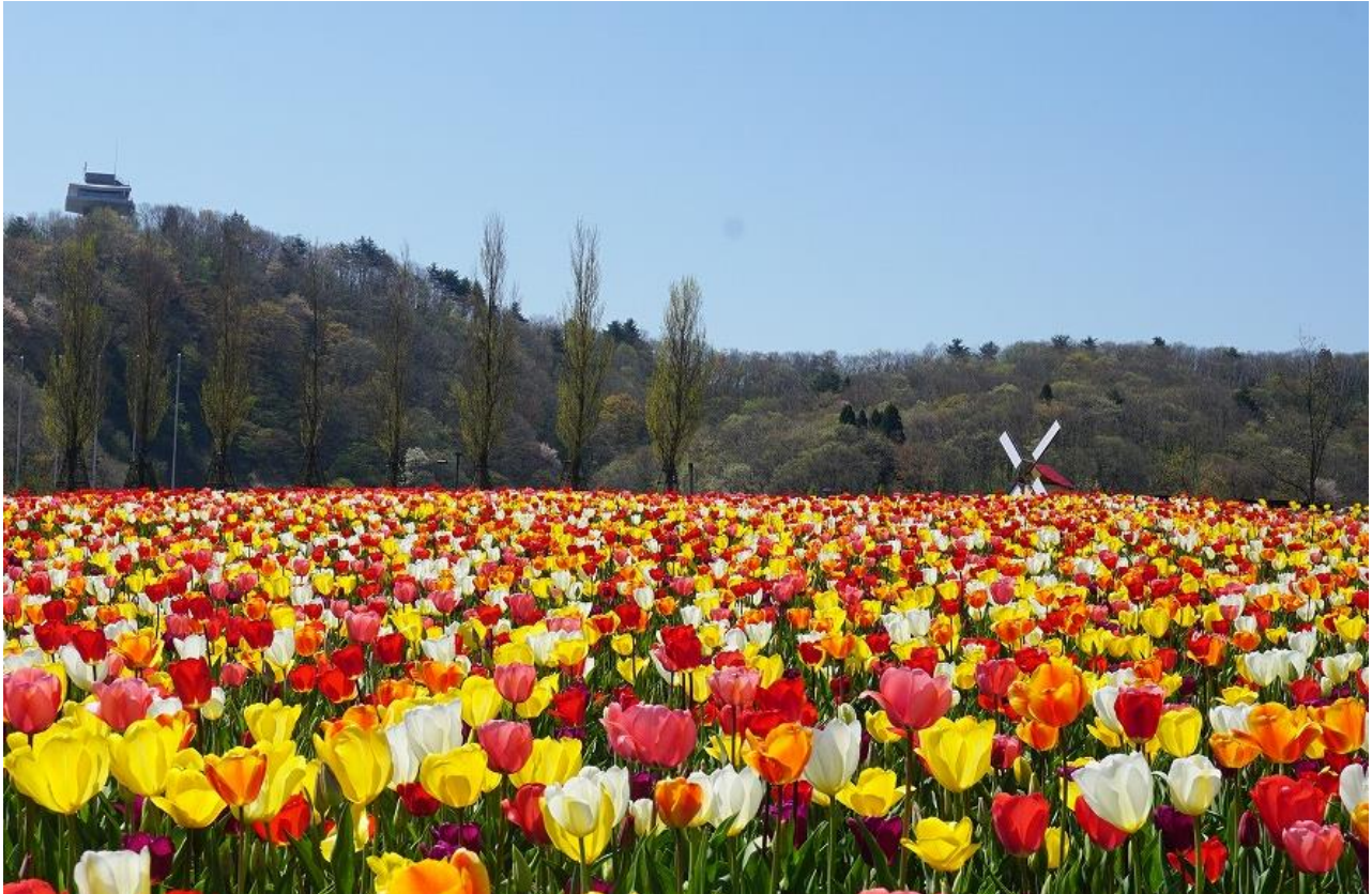
見頃を迎えた「花の丘」暖色系ミックスエリア（本年四月二十五日撮影）