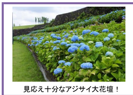
見応え十分なアジサイ大花壇！