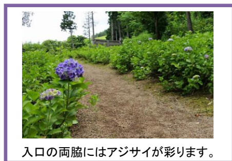
入口の両脇にはアジサイが彩ります。

梅雨入りして雨の多い季節、傘にあたる雨粒の音を聞きながら、アジサイを眺めるのも、日本らしい梅雨の楽しみではないでしょうか。