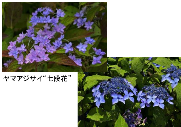
ヤマアジサイ“七段花”

アジサイの多くは土が酸性であれば「青色」になり、中性～弱アルカリ性であれば「ピンク色」になると言われています。本公園のアジサイは「青色系」が多くなっています。