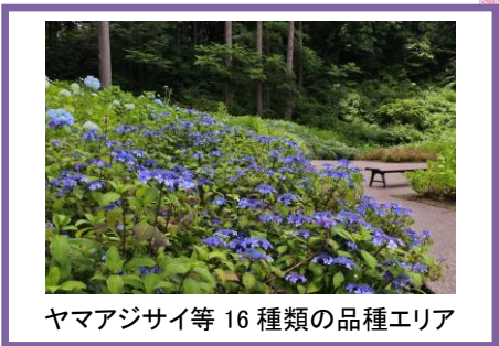
ヤマアジサイ等 16 種類の品種エリア