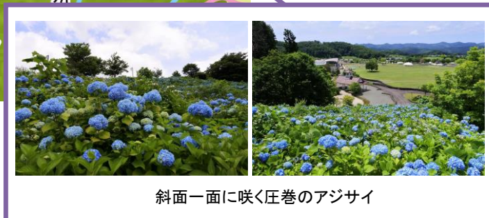
斜面一面に咲く圧巻のアジサイ