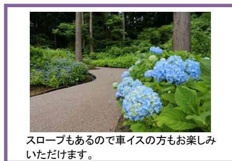
スロープもあるので車イスの方も楽しみいただけます。