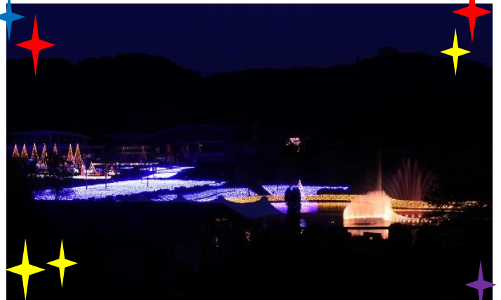
自然探勝路橋からの景色