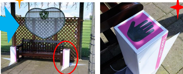
ハートのベンチに仲のいい2人が手を繋ぎ、スイッチにタッチするとイルミネーションがさらに輝きます！