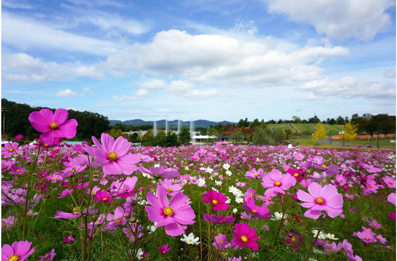
爽やかな秋空の下、花の丘に咲くコスモス 昨年10月21日撮影