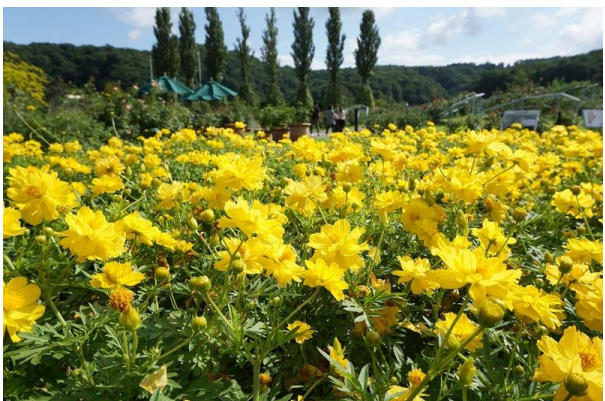
キバナコスモス 9月8日撮影

花の丘の品種紹介コーナーでは、品種改良を重ねて作られたコスモスの数々をご覧ください。現在品種によっては見頃を迎えています！“キバナコスモス”をはじめ、花びらの色や形の違いをどうぞお楽しみください。