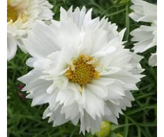
“ダブルクリックスノーパフ”