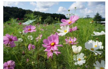
花の丘 開花状況 9月12日撮影