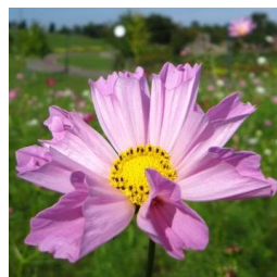
“シーシェル” 筒状の花びらが特徴