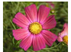
“クリームゾンキャンパス”