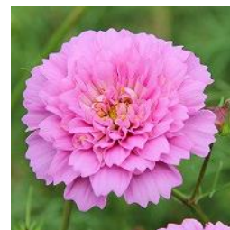
“ダブルクリック” 八重咲き品種