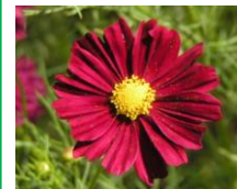
“ディーフレッドキャンパス”