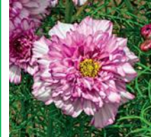
“ダブルクリックハイカラー”