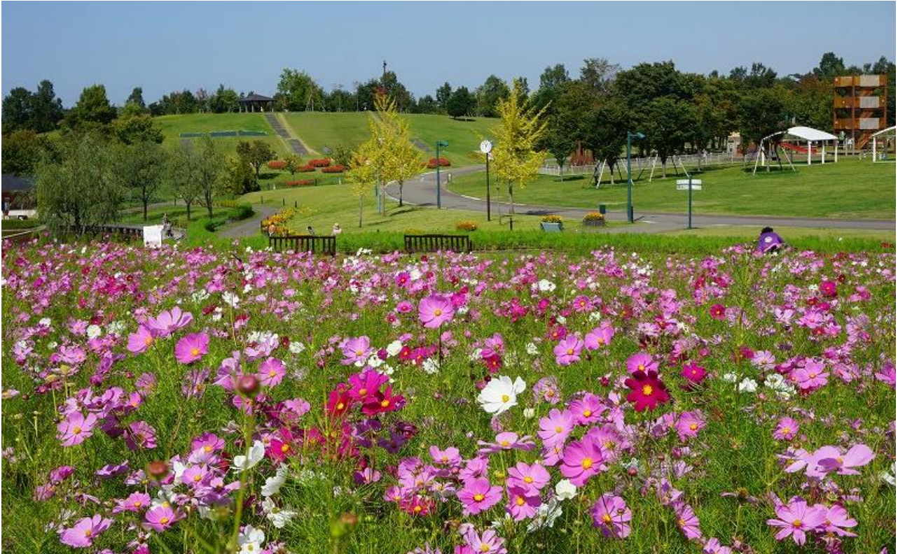
まもなく見頃！花の丘の「コスモス」 本年9月26日撮影