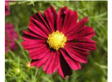
“ディーブレッドキャンパス”