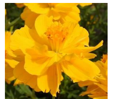
“キバナコスモス ロードイエロー”