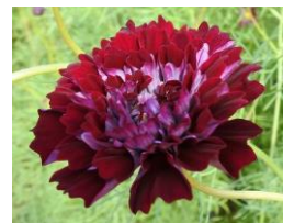
“ダブルクリックランパリー”