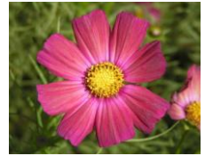
“クリムゾンキャンパス” 新品種は、越の池花壇でご覧いただけます！