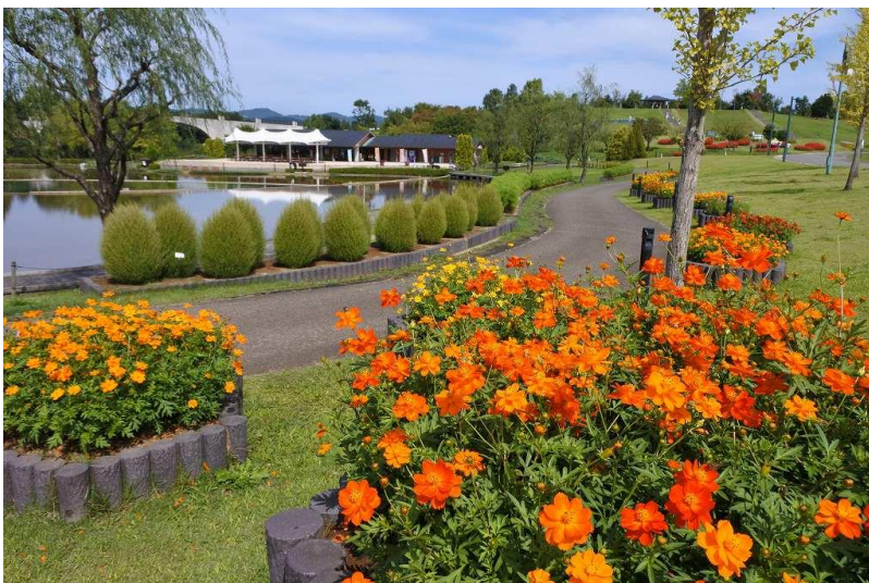
“キバナコスモス”の品種数が増え、越の池花壇を彩ります！ 本年 9 月 22 日撮影

越後丘陵公園では、 38 品種 のコスモスをご覧いただけます。 品種数は新潟県NO1! 八重咲き、絞り模様など、花びらの色や形の違いをどうぞお楽しみください。