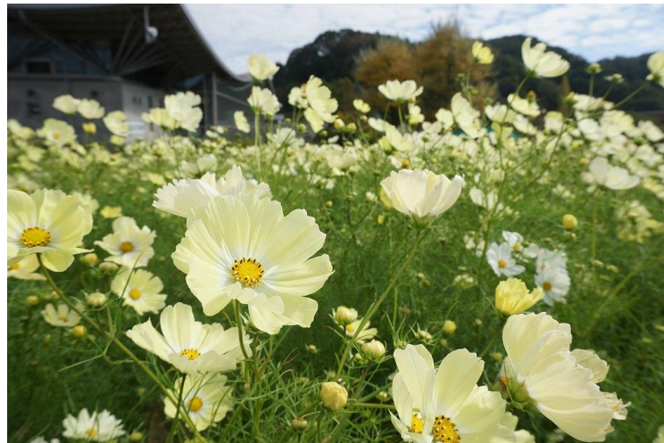
昨年の開花状況 昨年 10 月 16 日撮影

10月中旬には珍しいレモンイエローのコスモス“ イエローキャンパス ”が見頃を迎えます。 新潟でこの品種を約5万本観賞できるのはここだけ！！ そして今年は、大人気のキャンパスシリーズの品種数が増えました！