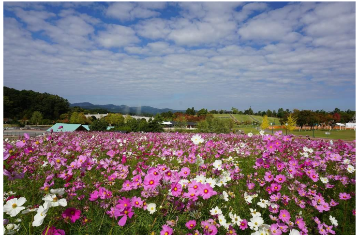
昨年の開花状況 昨年 10 月 19 日撮影