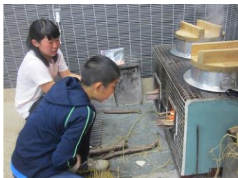
かまどでご飯炊き