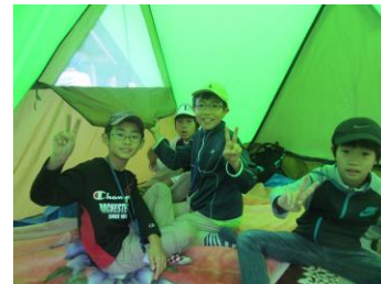
夜はみんなでテント泊