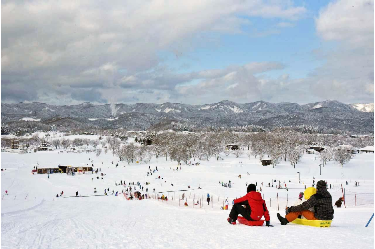
ゲレンデ利用風景 平成30年1月14日撮影

国営越後丘陵公園では、雪を最大限に楽しめる ホワイトシーズン がスタートし、各種ゲレンデが順次利用を開始しています。