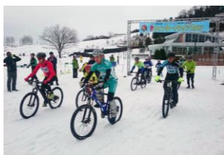
越後ウインタートライアスロン 2018 2/4(日)