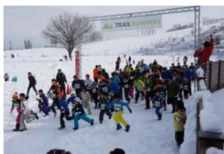
越後 FUN スノートレイル 1/28(日)