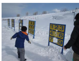
ウインターフェスタ 2/10(土)～12(月祝)

スノーモービルトレイン、エアチューブ体験、雪中ゲーム大会などイベント盛りだくさんの3日間！