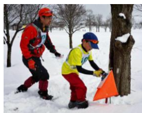
雪上ロゲイニングin 越後丘陵公園 2/18(日)