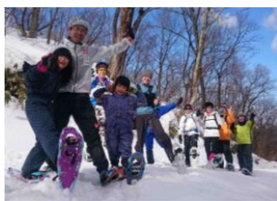
スノーシュー スクール&ガイド 1/20(土)、2/3(土)

ホワイトシーズンでは、雪上競技の大会やスノーシュースクールその他、様々なスノーアクティビティイベントも目白押しです。