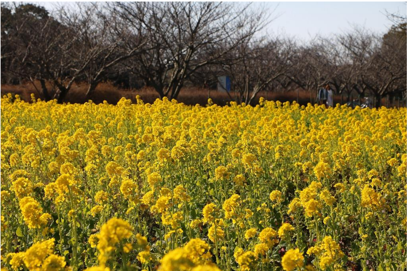
(1月26日撮影、サイクリングコース沿い、大型遊具「スカイドルフィン」近くにて)

貴社におかれましては、日ごろより海の中道海浜公園の広報にご協力いただきまして誠にありがとうございます。 まだまだ寒い日が続きますが、園内では、 ナノハナが5分咲きとなり、鮮やかな黄色の絨毯が広がります。 あたりには、ナノハナの甘い香りが漂います。2月上旬には見ごろを迎える予定です。 ご多忙中のこととは存じますが、取材ならびに記事掲載のほどよろしくお願いたします。